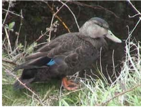
Figure 21. Le Canard noir est un utilisateur de la ZICO du Banc-de-Portneuf, entre autres au moment de la nidification.

pers ; Gauthier et Aubry, 1995). Le Canard noir ( Anas rubripes ) (Figure 21) niche dans le marais à spartine à l'intérieur de la barre de sable (R. Gilbert comm. pers. ; Gauthier et Aubry, 1995) ainsi que dans le marais bordant la rivière, comme l'ont confirmé les observations réalisées à l'été 1999. Aussi, depuis deux ans, des Eiders à duvet ( Somateria mollissima ) (Figure 22 et Figure 23) nichent sur le banc et on note la présence de crèches dans l'estuaire de la rivière Portneuf et le long du banc.