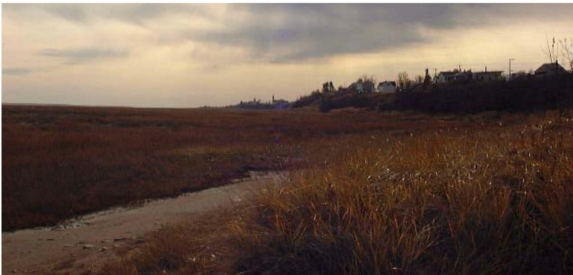
Figure 8. Vue de la zone littorale urbanisée bordant le marais salé