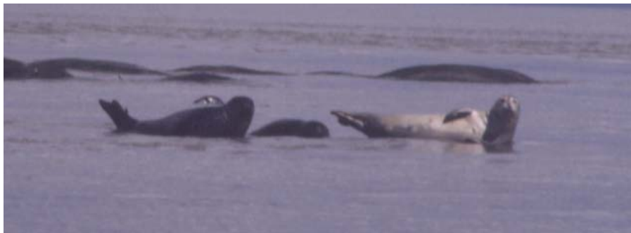
Figure 26. Des Phoques gris se reposant sur la grève découverte par la marée baissante.

Une carte sur les données de l'estuaire maritime (Pêches et Océans Canada, n. d.) montre que la pointe des Fortin et la section littorale située au nord de celle-ci servent aussi, du printemps à l'automne, d'échouerie pour le Phoques gris. La même carte montre également, le long de la barre de Portneuf et au sud de celle-ci, une vaste échouerie utilisée, en hiver, par le Phoques du Groenland. Ces deux échoueries ne seraient plus fréquentées par les phoques depuis quelques années (Yvon Bélanger, comm. pers.).