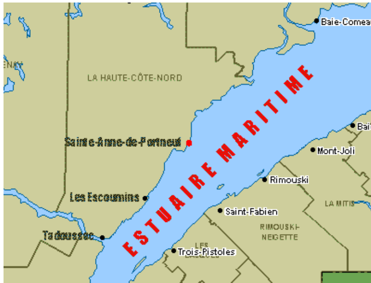
Figure 7. Localisation de l'estuaire maritime du Saint-Laurent

La ZICO est située au niveau de l'estuaire maritime du Saint-Laurent, où l'eau est salée et les marées sont fortes. La circulation d'eau dans ce secteur du golfe est de type estuarien. En effet, les processus océanographiques qui s'y déroulent sont d'un grand intérêt : entre Les Escoumins et Tadoussac (Figure 7), la profondeur de l'eau décroît rapidement, ce qui fait qu'à cet endroit le relief sous-marin favorise la remontée des eaux froides de la couche intermédiaire, riches en substances nutritives et en organismes planctoniques (Centre Saint-Laurent, 1996). Dans l'estuaire maritime du Saint-Laurent, les ondes de marées sont semi-diurnes, c'est-à-dire qu'elles comportent deux cycles par jour. Ces marées engendrent des courants horizontaux d'une vitesse de 0,25 m/s ou moins (Centre Saint-Laurent, 1996).