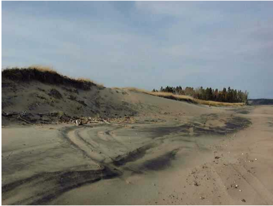
Figure 29. Sur le banc de sable, on constate par endroits une forte circulation des VTT. Le pourtour des îlots boisés y est particulièrement sensible.