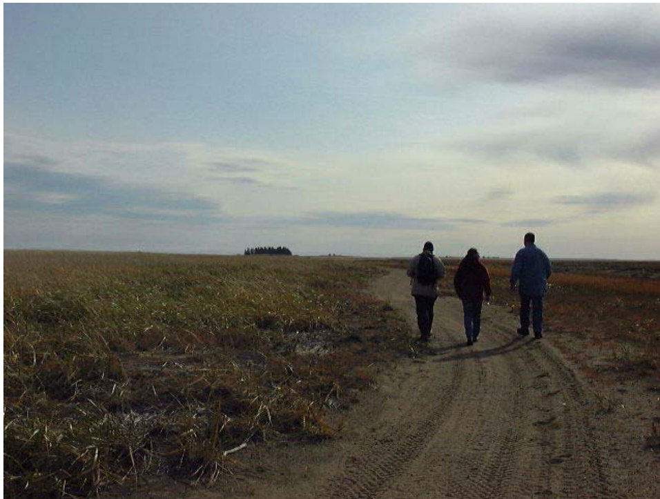
Figure 6. Chemin sur la pointe des Fortin. À l'horizon, on aperçoit un îlot boisé qui est situé sur la barre de sable.

La pointe des Fortin borde la rive gauche de l'estuaire de la rivière Portneuf et s'avance sur près de 500 m dans l'estuaire maritime du Saint-Laurent (Figure 6). Le substrat de la pointe des Fortin est surtout composé de sable fin à moyen. Ce milieu dunaire demeure émergé même à marée haute. La pointe des Fortin supporte une végétation dominée par l'Élyme des sables et la Gesse maritime.