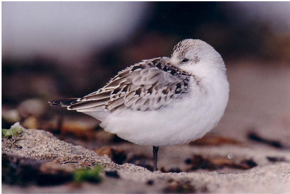
Figure 14. Bécasseau sanderling au repos