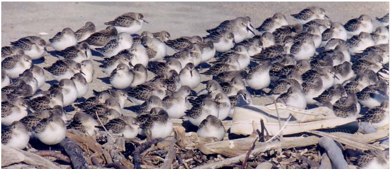
Figure 15. Regroupement de Bécasseaux semipalmés abrités du vent derrière des débris de grève.

Parmi les espèces de bécasseaux que l'on retrouve sur les rivages de cette ZICO lors des rassemblements automnaux, le Bécasseau semipalmé (Figure 15) est sans contredit le plus abondant. En 1994, au cours d'une seule journée, on a recensé 7 000 individus dans la ZICO du Banc-de-Portneuf. Pour ce même site, durant la période migratoire automnale de 1993, le nombre d'individus inventoriés a été de 58 282, ce qui représente 1,7 % de la population mondiale de cette espèce.