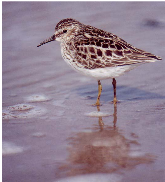
Figure 13. Le plus petit de tous les oiseaux de rivage du monde, le Bécasseau minuscule est un migrateur qui parcourt des distances incroyables.