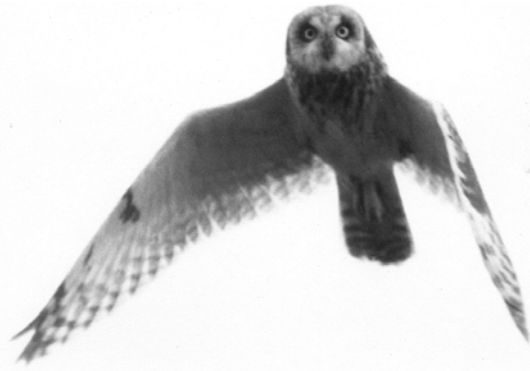
Figure 24. Le Hibou des marais est un espèce menacée de disparition au Canada.

Lors des migrations automnales, le banc de Portneuf est un site d'alimentation essentiel pour les oiseaux de rivage (Naturam Environnement, 1998 ; Bourget, 1990). Des concentrations très élevées de limicoles peuvent alors y être observées. Les premiers limicoles, des chevaliers, se présentent vers le 15 juillet.