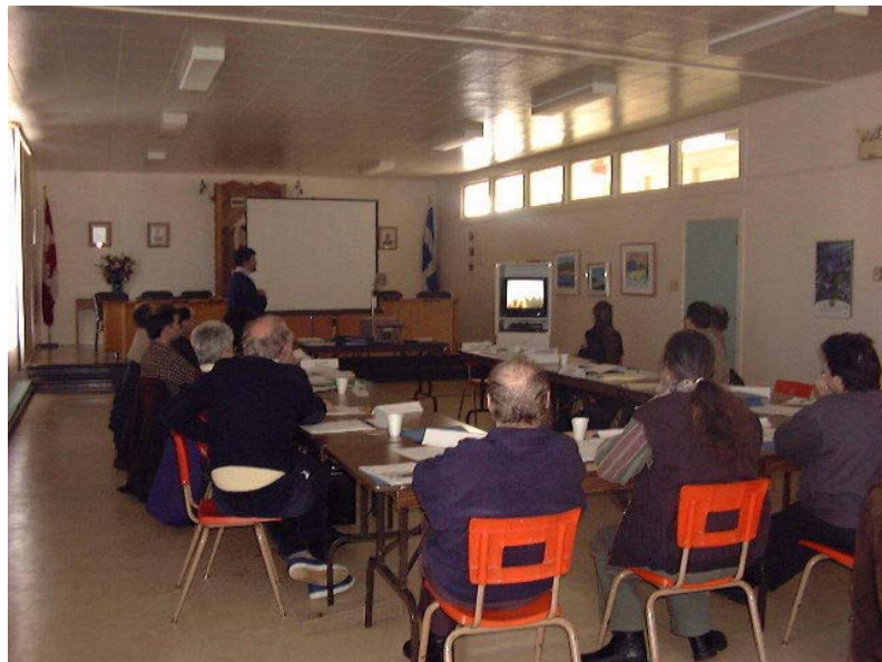
Figure 2. Atelier de concertation du 30 janvier 2001

Ainsi, le processus de planification communautaire qui en a résulté a impliqué la plupart des corporations et des propriétaires touchés par la ZICO du banc de Portneuf. Il a permis d'identifier les actions de conservation à entreprendre et les partenaires qui pourraient participer à l'atteinte des objectifs. Une fois complété, le plan servira à mobiliser les ressources financières, humaines et matérielles nécessaires à la mise en œuvre des activités planifiées.