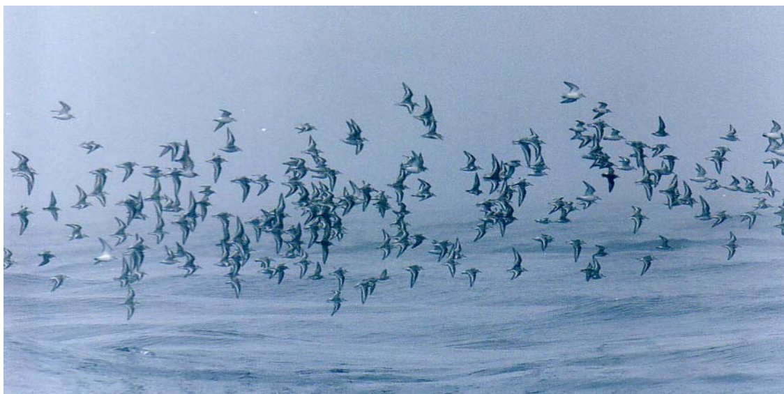
Figure 11. Volée de bécasseaux au-dessus de l'eau