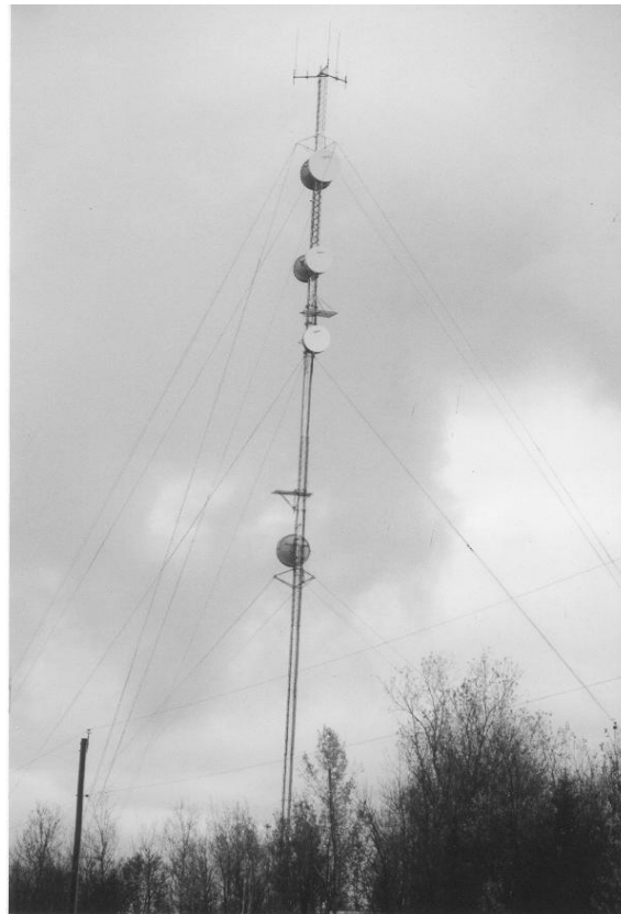
Figure 32. Les tours avec haubans seraient plus résistantes au verglas.

Parmi les projets en cours qui démontrent l'intérêt du milieu pour le développement du site, mentionnons celui de l'aménagement d'un sentier multifonctionnel qui rejoint actuellement la municipalité de Forestville depuis la pointe des Fortin. Le sentier projeté pourrait également rejoindre Longue-Rive à l'ouest et éventuellement s'étendre plus loin en Haute-Côte-Nord.