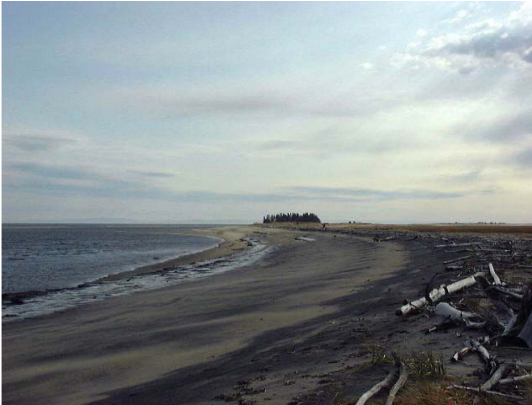
Figure 4. Sur la barre de sable, sont présents trois îlots boisés comme celui que l'on voit au fond, au centre de la photo.