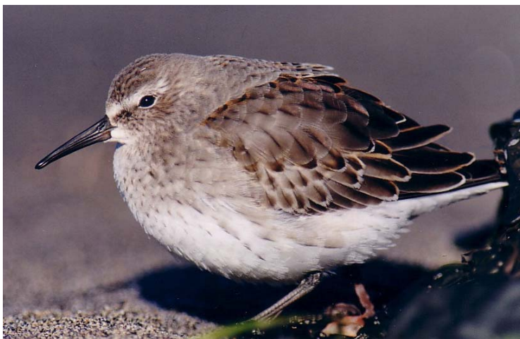
Figure 12. Les grandes quantités de Bécasseaux à croupion blanc fréquentant la ZICO du Banc-de-Portneuf confèrent à ce site une importance mondiale.

En 1993, les effectifs cumulatifs comptés au banc de Portneuf ont été de 9 935 individus pendant la seule période de migration automnale, ce qui fait de la ZICO du Banc-de-Portneuf un site d'importance mondiale pour cette espèce.