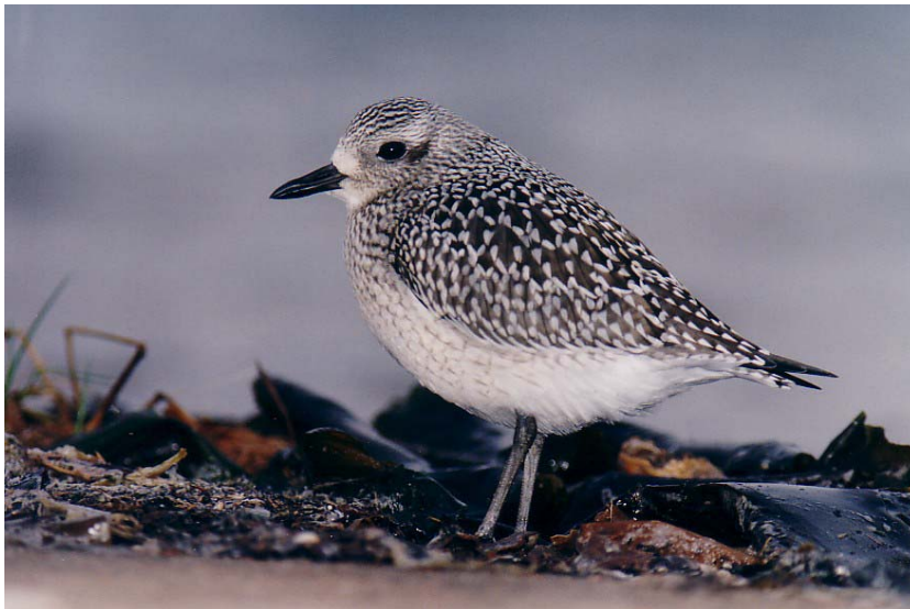
Figure 16. Pluvier argenté en plumage d'hiver