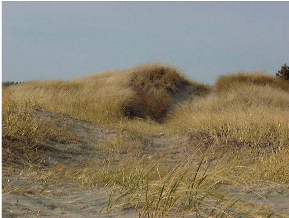
Figure 30. La végétation dunaire, qui protège les dunes contre l'érosion, est dégradée par la circulation répétitive des VTT.