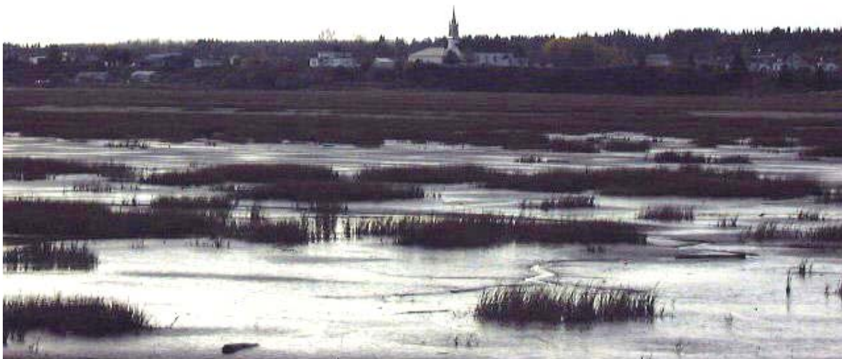
Figure 5. Vue du marais salé situé en bordure de la bande littorale urbanisée

La végétation du marais salé situé entre la barre et le littoral (42 ha) (Figure 5) est principalement représentée par un herbier de Spartine alterniflore ( Spartina alterniflora ) (Figure 9), bordé par une mince bande d'herbaciaie salée d'environ 2 à 10 m selon l'endroit. Les chenaux d'écoulement et les mares sont peu profonds. Les mares couvrent 10 à 30 % de la superficie du marais. Onze espèces végétales ont été répertoriées dans l'ensemble de ce marais, dont notamment la Spartine étalée ( Spartina patens ), une espèce typique des marais de la rive sud de l'estuaire, très peu commune sur la rive nord. Cette spartine y forme une petite colonie de deux hectares où elle domine. Mentionnons également la présence d'un petit herbier de Zostère marine ( Zostera marina ) à l'ouest du marais abrité derrière la barre (Figure 9).