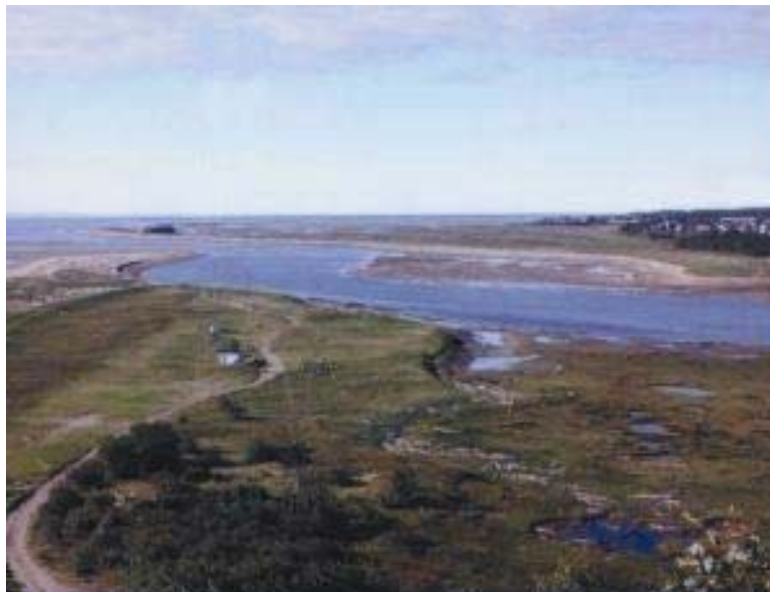
Figure 1. Vue de l'estuaire de la rivière Portneuf. Au fond, le banc de Portneuf.

Ce plan de conservation est une adaptation du Plan de protection et de mise en valeur du banc de Portneuf (Heppell et al. , 2001), qui découle de l'implication des membres d'un comité ad hoc formé par le Comité ZIP de la rive nord de l'estuaire, la Société de la faune et des parcs du Québec, Hydro-Québec, le Comité Côtier Les Escoumins à la rivière Betsiamites, la Municipalité de Sainte-Anne-de-Portneuf, l'Union québécoise pour la conservation de la nature ainsi que par plusieurs autres individus intéressés par l'avenir du banc de Portneuf. Les idées véhiculées dans ce document ont été discutées par les membres du comité et ont fait l'objet d'un consensus suite à la tenue de quatre réunions de concertation. Une conférence de presse a eu lieu à Sainte-Anne-de-Portneuf pour annoncer le dépôt du Plan de protection et de mise en valeur du banc de Portneuf pour consultation publique. Cette consultation publique a eu lieu le 19 septembre 2001 et a permis de valider, avec la population, le contenu du plan. Les commentaires et suggestions recueillis lors de cette consultation seront pris en considération lors de la mise en application du plan.