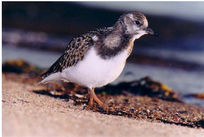
Figure 17. Le Tournepierre à collier en plumage d'hiver est plus terne que lorsqu'il arbore ses atours nuptiaux, mais il garde suffisamment du motif de base pour être facilement identifiable.