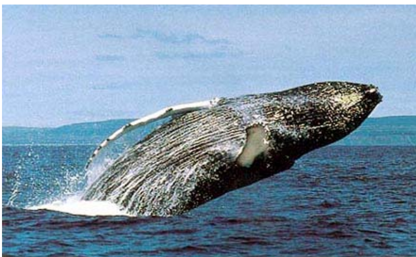
Figure 25. Le Rorqual à bosse, ce mammifère marin qu'on voit parfois jaillir hors de l'eau et se laisser retomber à plat, peut être observé près du banc de Portneuf.

Les cétacés profitent de cette richesse en nourriture, favorisée à la fois par la présence de ces habitats côtiers et des courants profonds d'eau froide remontant dans l'estuaire maritime par le chenal laurentien. Le secteur est un endroit particulièrement propice à l'observation du Petit Rorqual ( Balaenoptera acutorostrata ), du Rorqual commun ( Balaenoptera physalus ) et du Rorqual bleu ( Balaenoptera musculus ) qui viennent s'y alimenter en saison estivale (Boisseau, 1998). D'autres espèces de cétacés peuvent aussi être aperçues, tels le Marsouin commun ( Phocoena phocoena ) ou le Rorqual à bosse ( Megaptera novaeangliae ) (Figure 25).