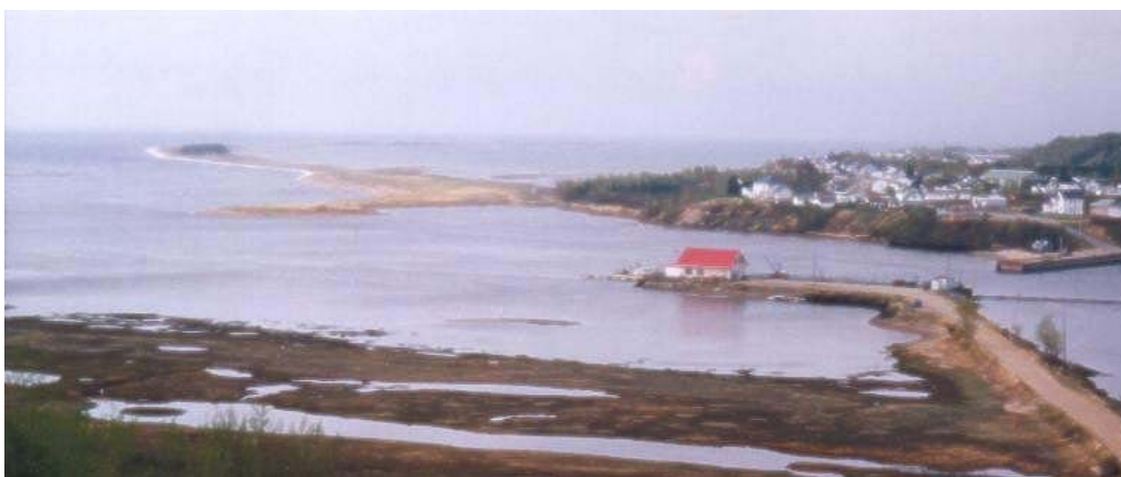
Figure 27. En plus d'offrir une rampe de mise à l'eau, la marina présente à l'embouchure de la rivière Portneuf est le point de départ d'excursions permettant d'aller explorer le secteur maritime entourant le banc.

Il est également possible d'explorer en embarcation le secteur maritime entourant le banc. À cet effet, une rampe de mise à l'eau est à la disposition des utilisateurs de la marina située à l'embouchure de la rivière Portneuf (Figure 27). Cette dernière compte une trentaine de places à quai, dont dix pour les visiteurs. Le quai fédéral, situé en rive droite de la rivière, offre aussi une rampe de mise à l'eau. Ce quai sera cependant démantelé sous peu et les équipements servant à décharger les bateaux de pêche seront transférés à la marina. Par contre, la rampe de mise à l'eau sera maintenue en place.