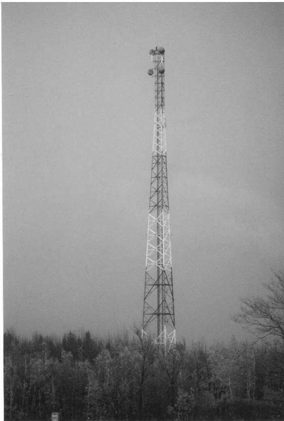
Figure 31. Les tours sans haubans sont considérées moins dangereuses pour les oiseaux migrants.