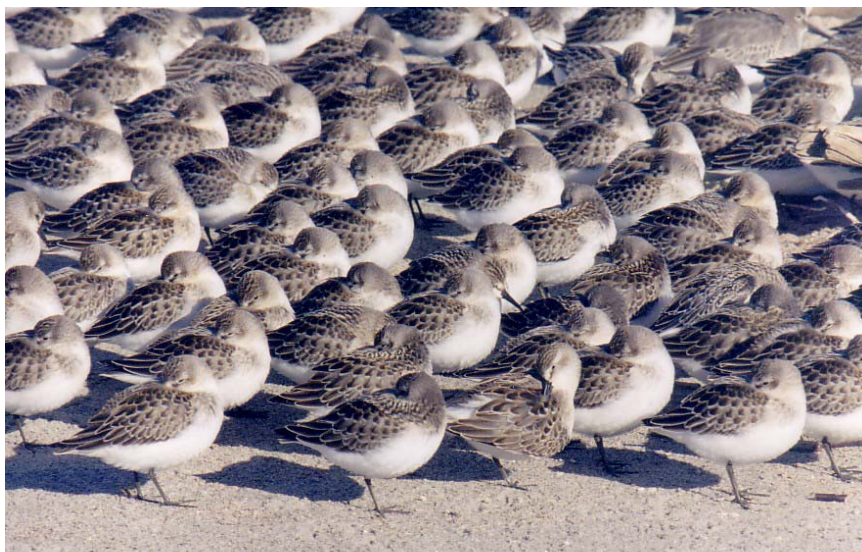
Figure 10. Rassemblement de Bécasseaux semipalmés au repos

Le banc de Portneuf représente un site privilégié pour l'observation des oiseaux (Cyr, 1992 ; David, 1990). Il est notamment renommé pour l'observation de très grands rassemblements migratoires (Figure 10 et Figure 11), ainsi que pour la présence d'espèces peu communes (Tableau 2). Ce site accueille environ 6 % des limicoles en migration recensés sur l'ensemble du territoire québécois (Maisonneuve et al. , 1990). À l'automne 1990, on y a dénombré quelque 14 770 oiseaux appartenant à 16 espèces différentes (Bourget, 1991).