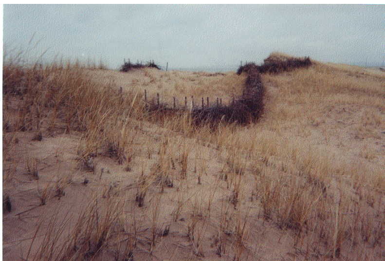
Figure 34. La mise en place de clôtures de branchage est une technique de stabilisation des dunes utilisée aux Îles de la Madeleine.

La barre de sable abrite également certains sites d'érosion générée par l'activité humaine. Certains de ces sites pourraient être restaurés à l'aide de techniques de stabilisation déjà éprouvées telles la plantation de l'élyme des sables ou la mise en place de clôtures légères pour la retenue des sédiments éoliens (Figure 34).